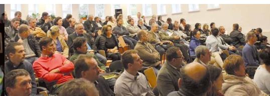
Lisków, powiat kaliski