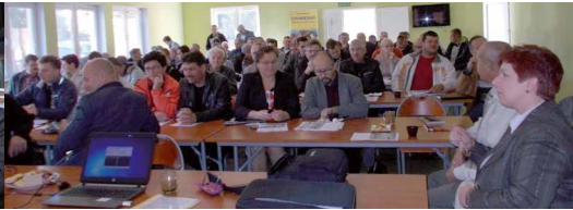
Brzostowo, powiat pilski