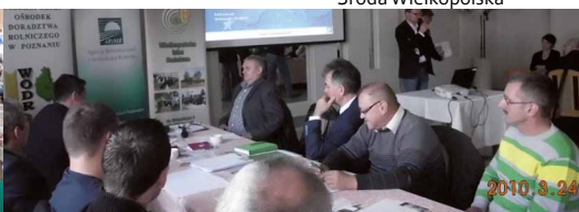
Margonin, powiat chodzieski