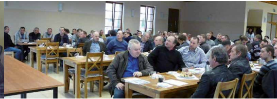
Kamieniec, powiat grodziski