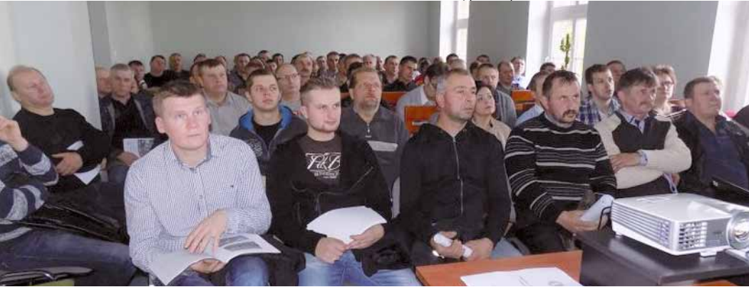
Czarnków, powiat czarnkowsko-trzcianecki