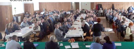
Kramski, powiat koniński