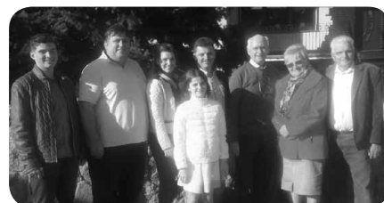
Gospodarstwo Państwa Jędrzejaków Kaliszkowice Ołoboczne (powiat kaliski)