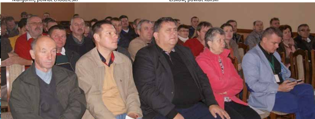
Gańów, powiat szamotulski