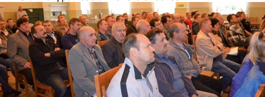
Wysocko Wielkie, powiat ostrowski